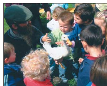
Quel plaisir pour les enfants de pouvoir toucher tous les animaux !

Un dossier thématique sera abordé à chaque numéro, le tout premier a été consacré au jeu. L'objectif est de donner aux parents quelques idées et références sur la petite enfance.