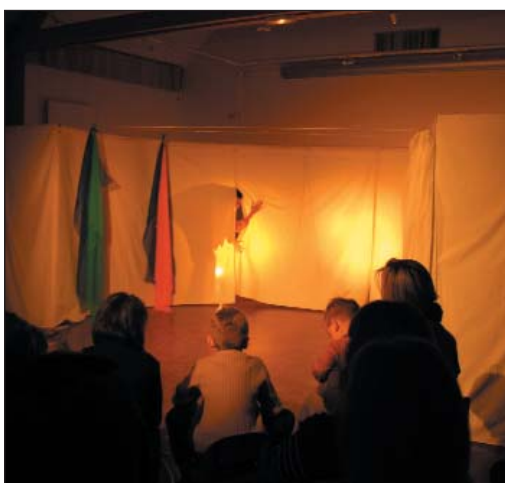
Les jeux d'ombres, de lumières et de couleurs et la poésie du spectacle ont particulièrement attiré l'attention des petits spectateurs