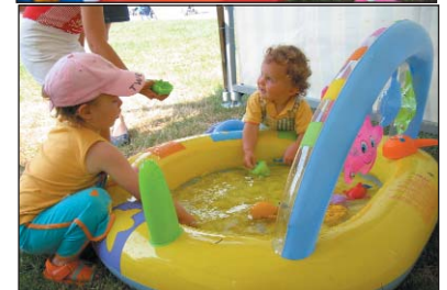
Les tout-petits avaient leur espace et les plus grands sont passés par tous les ateliers notamment les jeux d'eaux qui rencontrent toujours le même succès !