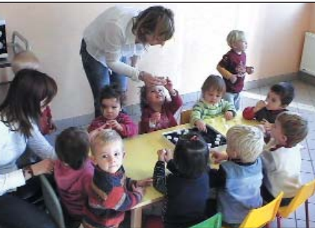
Les activités mises en place donnent aux enfants la possibilité de laisser libre cours à leur imagination