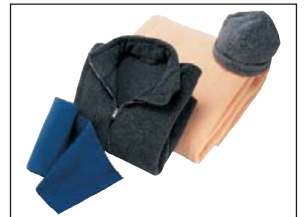
Les débouchés du recyclage des bouteilles plastique sont nombreux notamment dans le textile

Une fois triés, bouteilles et flacons plastiques sont conditionnés en balles d'environ 1 m 3 à l'aide d'une presse et transportés vers une usine de régénération (une balle contient environ 5000 bouteilles). L'usine que nous avons visitée a une capacité de traitement de 21000 tonnes chaque année ! Les copeaux de plastique qui sortent de l'usine sont ensuite envoyés en Irlande. Là, ils deviendront des fils et fibres pour l'habillement, le rembourrage de couettes, d'anoraks, de peluches.