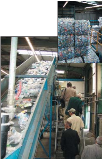
Cette visite a permis aux élus de constater la réalité du recyclage des matériaux

Les élus de la CC2V visitent une usine de recyclage