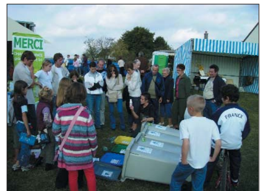
Les visiteurs ont été nombreux à participer aux animations mises en place pour la journée

Ces deux stands d'information ont été mis en place dans le cadre des Semaines Régionales de l'Environnement (SRE) organisées par le Conseil régional de Picardie. Elles ont lieu durant tout le mois d'octobre dans toute la région. Elles mettent en valeur des actions de sensibilisation au respect de l'environnement. Le service Environnement de la CC2V participe depuis plusieurs années à cette opération.