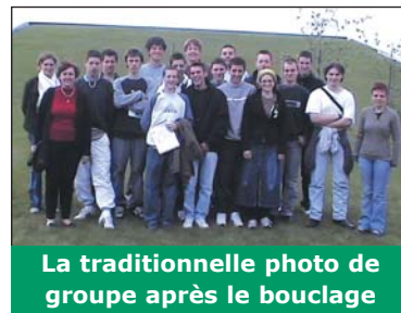
La traditionnelle photo de groupe après le bouclage

Ils ont suivi pendant quelques semaines l'équipe environnement pour collecter des informations et travailler sur une page de notre magazine. Ils se sont ensuite occupés de la rédaction et des photos. Du bon travail, merci !