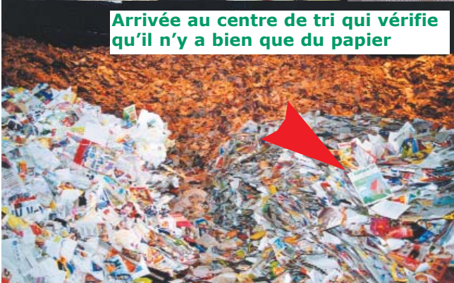
Arrivée au centre de tri qui vérifie qu'il n'y a bien que du papier