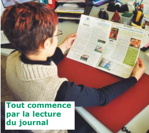
Tout commence par la lecture du journal