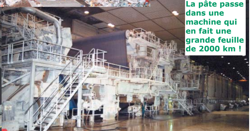
La pâte passe dans une machine qui en fait une grande feuille de 2000 km !