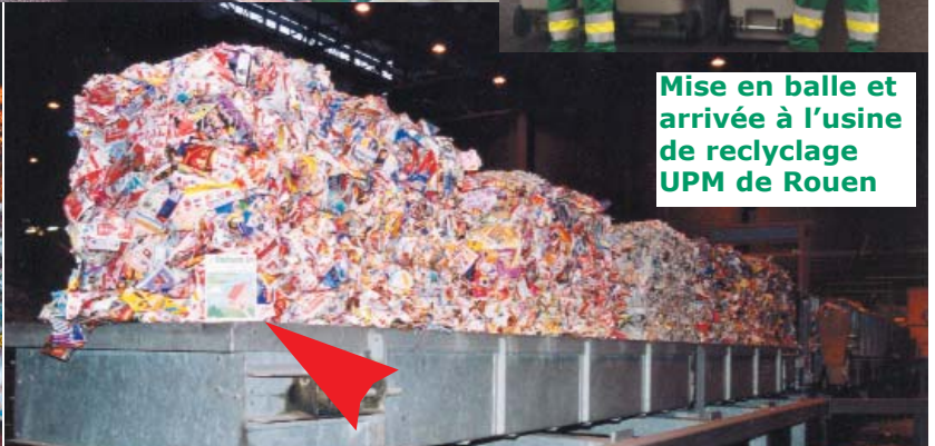
Mise en balle et arrivée à l'usine de recyclage UPM de Rouen