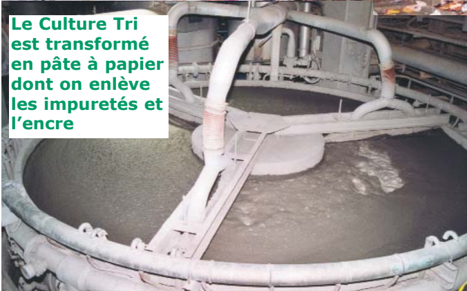
Le Culture Tri est transformé en pâte à papier dont on enlève les impuretés et l'encre