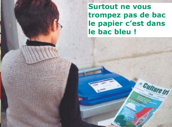
Surtout ne vous trompez pas de bac le papier c'est dans le bac bleu !