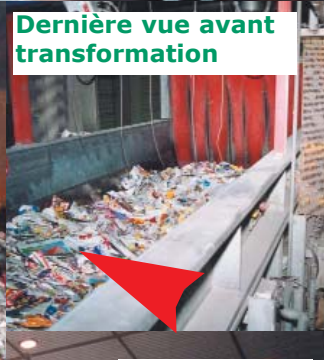
Dernière vue avant transformation