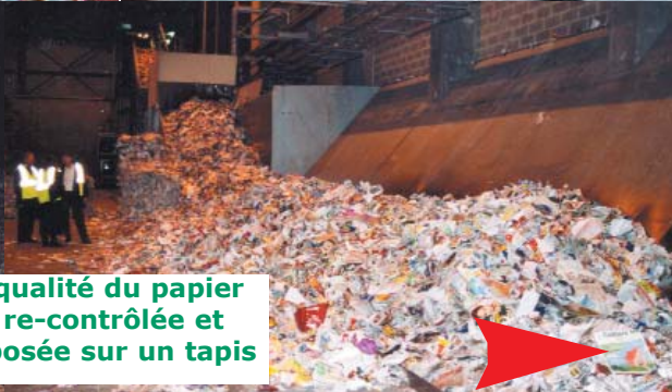
La qualité du papier est re-contrôlée et déposée sur un tapis