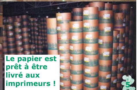
Le papier est prêt à être livré aux imprimeurs !