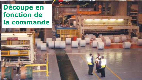
Découpe en fonction de la commande