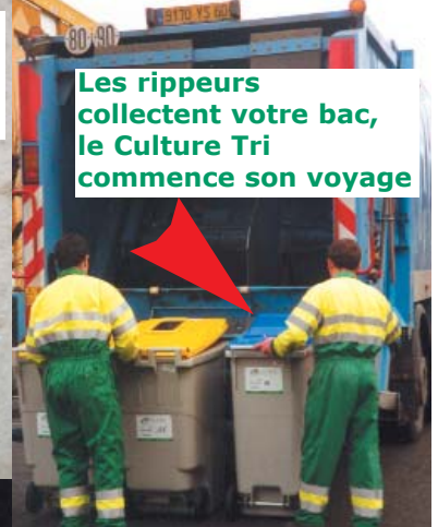
Les rippeurs collectent votre bac, le Culture Tri commence son voyage