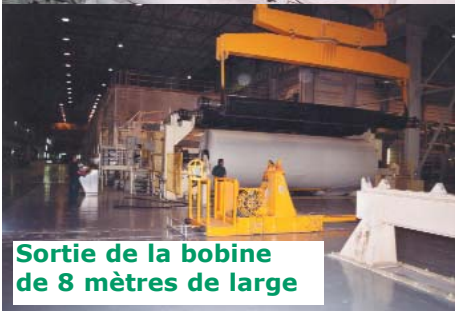
Sortie de la bobine de 8 mètres de large