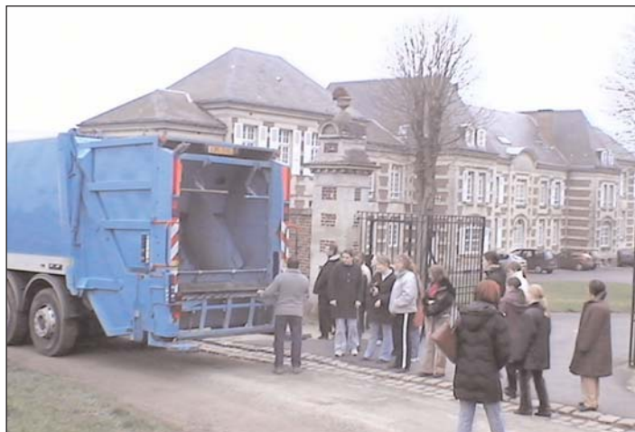
Explication du fonctionnement du camion

Classe de jeunes filles de l'IMPro de Ribécourt-Dreslincourt