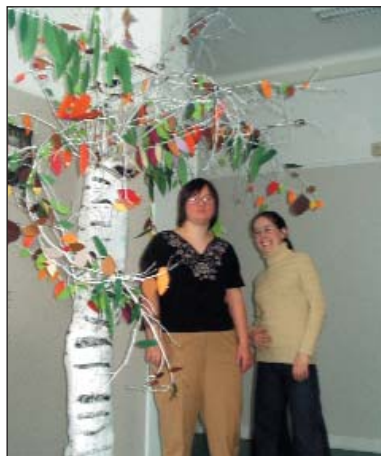
Un arbre en papier maché !

Il y avait deux grands arbres en papier journal et des animaux fabriqués avec du matériaux de recyclage.