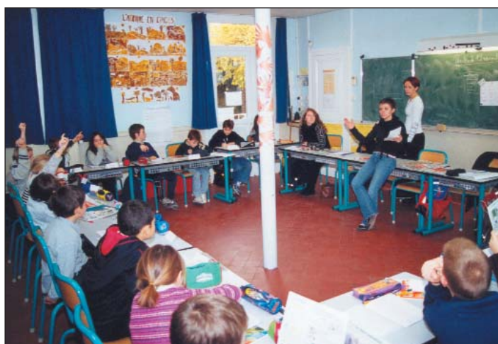
Quelques explications sur le tri pendant la classe

CULTURE TRI : Quand vous hésitez sur la poubelle dans laquelle jeter vos déchets vérifiez sur le calendrier de collecte ou sur votre guide du tri. Dans le doute, jetez dans votre bac gris.